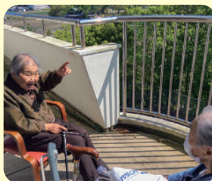
今日もいいお天気です