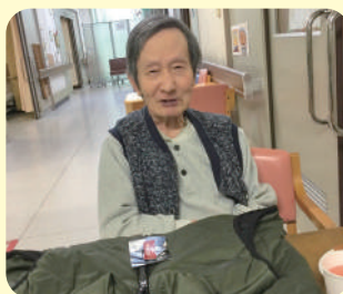
誕生日プレゼントをありがとう