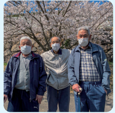
お花見に行ってきました。