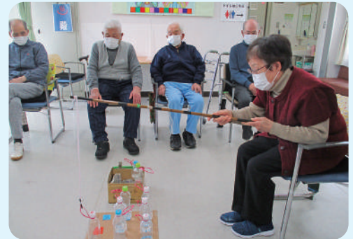
色々なレクリエーションを皆様とこなっています