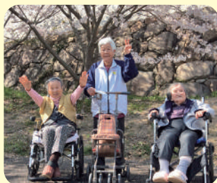
お花見に出かけました