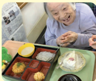
誕生日おめでとうございます ケーキ嬉しいな