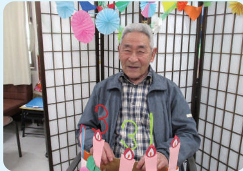
皆様に誕生日をお祝いしています。