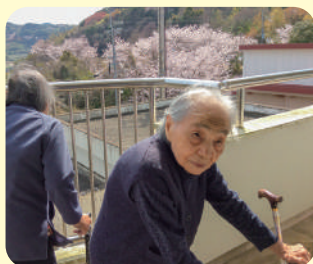
外気浴で桜を見ました