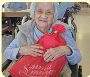
誕生日プレゼントをいただきました