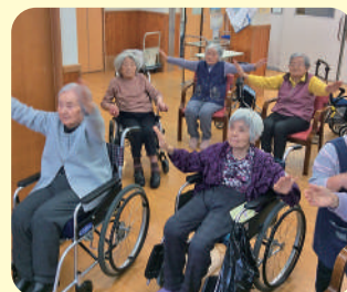
毎日体操に取り組んでいます