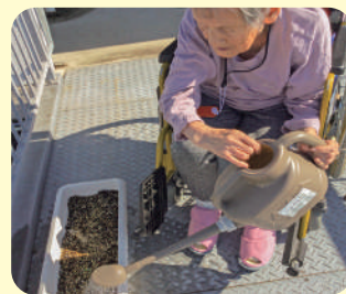
早く大きくなってね