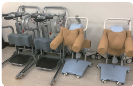
スタンディングリフトを導入!