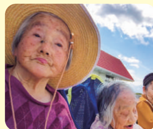
天気が良くて気持ちがいい