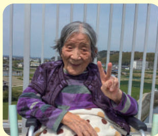
天気が良く気持ちが良いです