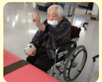
いつもリハビリ頑張ってます