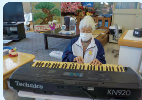
利用者様による歌の伴奏