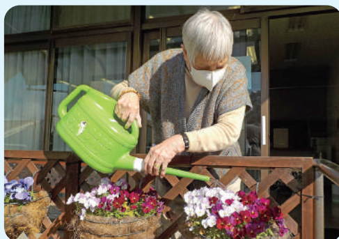
皆で植えた花がきれいに咲きました