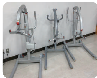
介護機器を次々と導入!