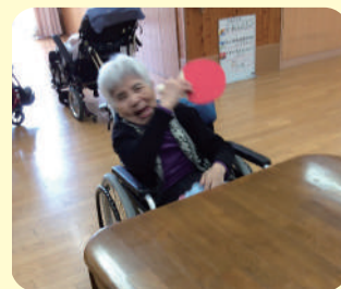
昔は卓球の選手でした