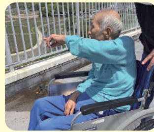
外気浴は気持ちいい