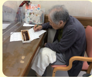
そろばんが得意です