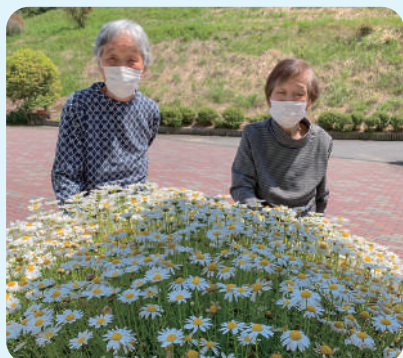
天気の良い日は外でお散歩