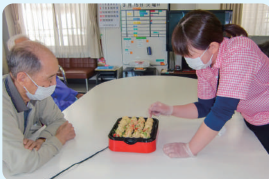
手作りおやつ、月2回のお楽しみです。