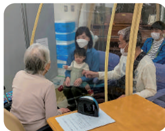
スクリーンテントでの面会実施中!