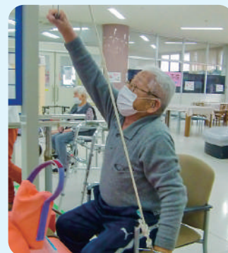
一生懸命に機能訓練を行っています