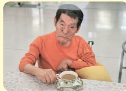
喫茶ほっとファイブ 喫茶コーナーで飲むコーヒーは格別です