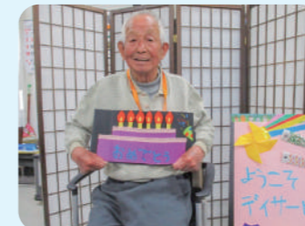
お誕生日おめでとう