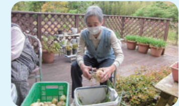
畑仕事 ええの出来たな～