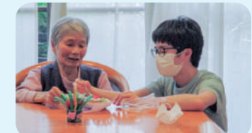
利用者様と団らん 仲良し～