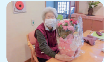
母の日 カーネーションと一緒に