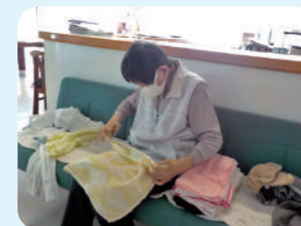
丁寧にたたみます～