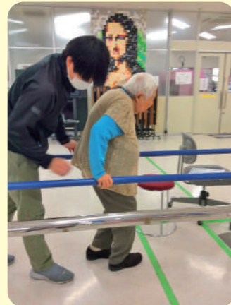
理学療法士による 歩行訓練 訓練楽しみにしています