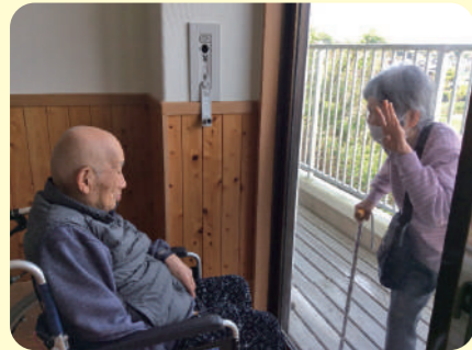
窓越し面会 感染症対策のため 窓越しにて面会を行っています