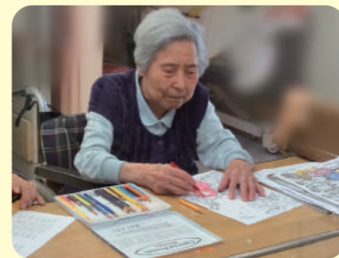
塗り絵 何色にしようか真剣に考えてます