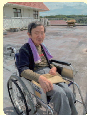
広いベランダからは 都志の町並みが よく見えます