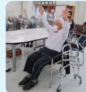
体を伸ばしましょう