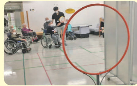
フライングディスク大会 感染対策をしながら少人数で行いました