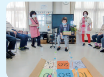
楽しいレクリエーション