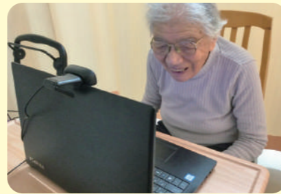
オンライン面会 ライン機能でご家族の顔を見ながらお話をしています