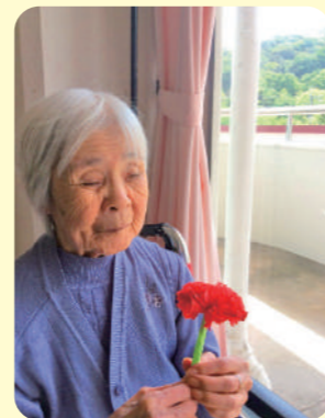
母の日 手作りのカーネーションを 持って記念撮影