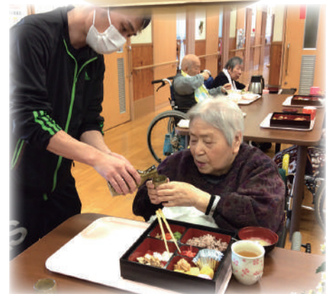
ごちそうに舌つづみ