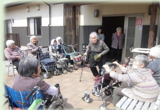
「今日はええ天気やねえ」話に花が咲きます