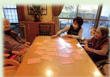
トランプで「どれかな～」