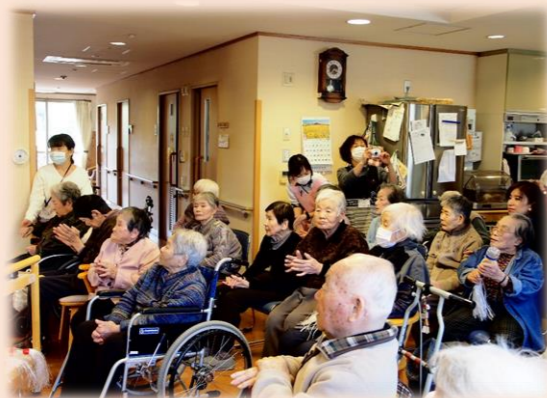
皆様手拍子で応援！