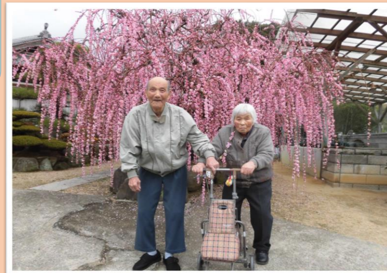
鮎原の木下邸にて