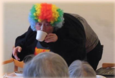
職員による二人羽織に爆笑！