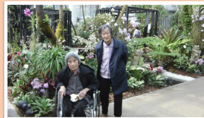
明石海峡公園『奇跡の星館』：デイサービス