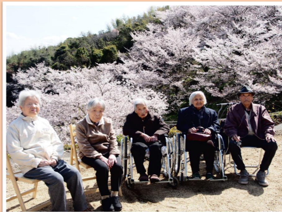
今年は特にきれいに咲いていました！