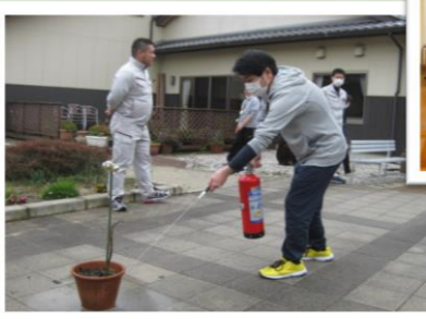
いざという時のために消火訓練