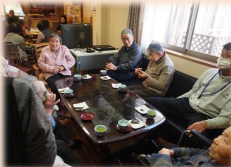
歌い終わった後はみんなでお茶会♪