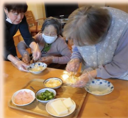
サンドウィッチ作り