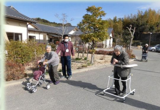
しっかりあるいて足腰強く！