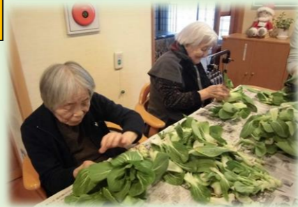
収穫した野菜の葉の仕分け