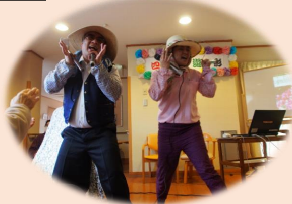
楽笑庵様によるパフォーマンス