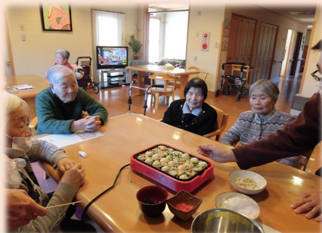
たこ焼きパーティー