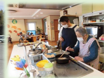
みんなで協力しておいしいお料理毎日作ってます