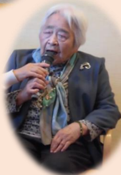
自慢の歌声を披露