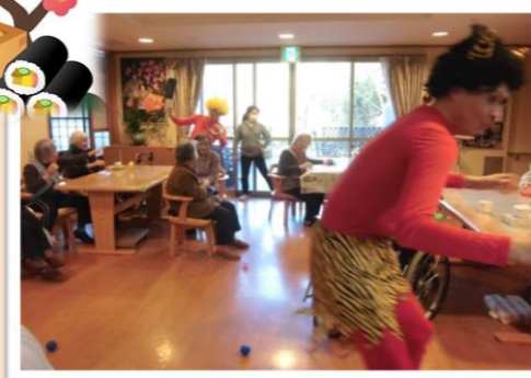
鬼めがけて「えいっ」