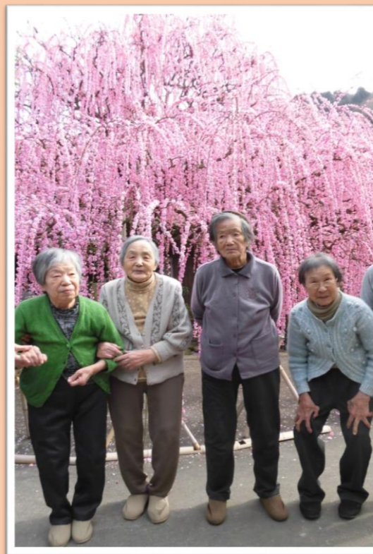
南あわじ市八木の村上邸にて しだれ梅を堪能しました