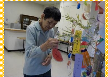
願い事を短冊に書きました