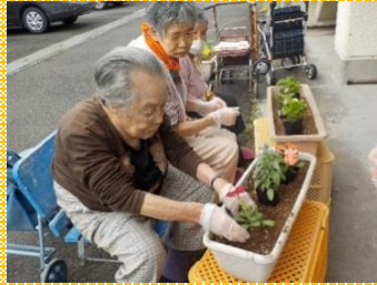
綺麗な花が咲きますように