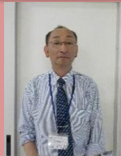
板倉センター長(4月1日付)