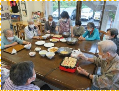
丸く焼くのがむずかしいね