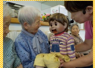
だいちゃん人形と