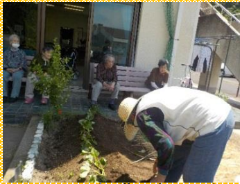
沢山収穫できるかな