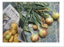
沢山収穫できました