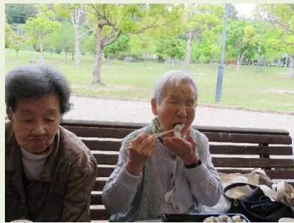
外で食べるお弁当は美味しい