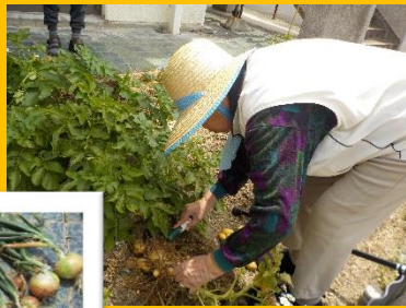
畑で野菜を育てています