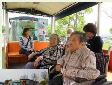
夢ハッチ号に 乗ったよ!