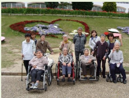
みんなで写真撮影