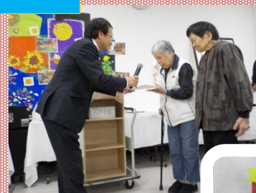
銅賞とセンター長賞を頂きました。