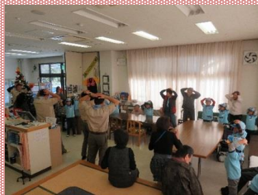
ゲームを楽しみました