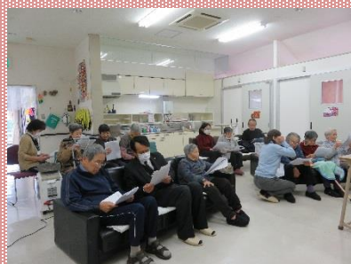
一年間を振り返って