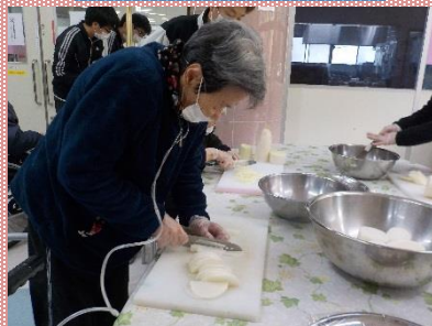
見事な包丁さばき！