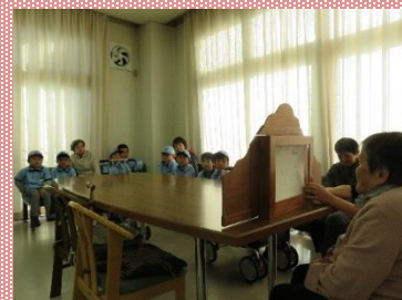
紙芝居に聞き入っています。