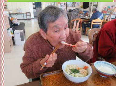
お鍋はカニが一番！