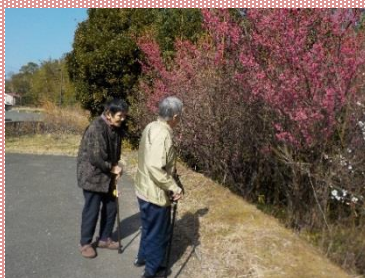
梅が咲いてきれいや！