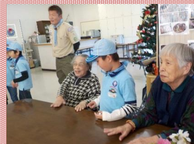
次は何をするのかな