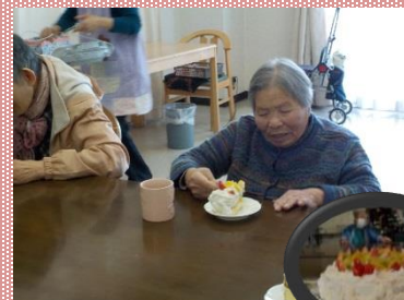
ケーキ美味しそう！