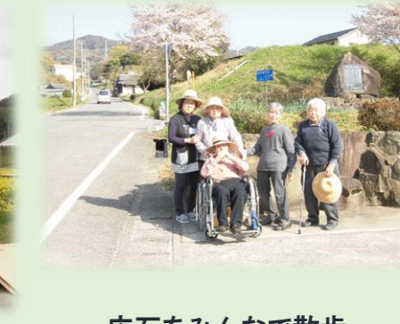
広石をみんなで散歩