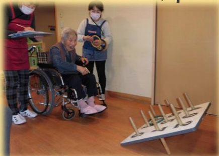
104歳もまだまだコントロールは抜群!