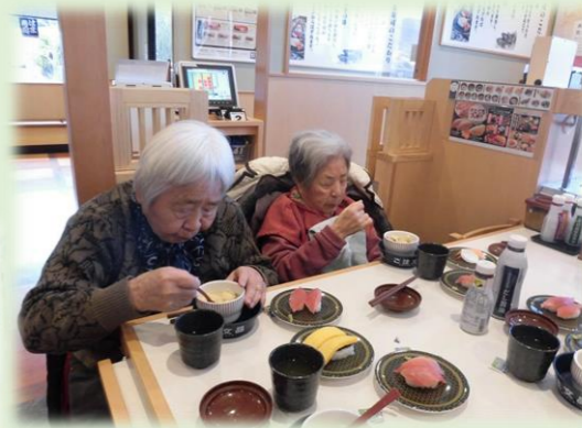
お寿司で昼食、みんな大好き