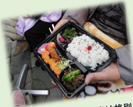
外で食べると弁当は格別