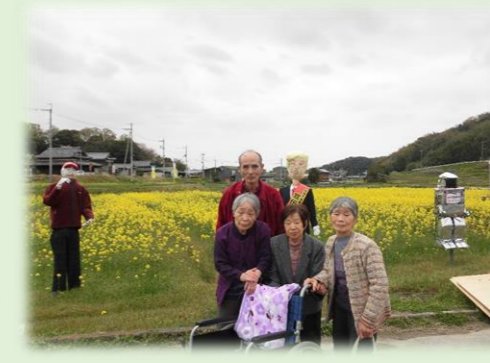
菜の花を観に行きました