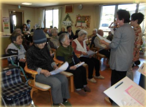
皆で声を合わせて歌います。