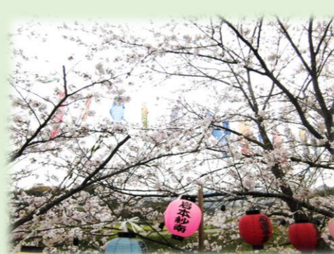
堺のみたから公園にて