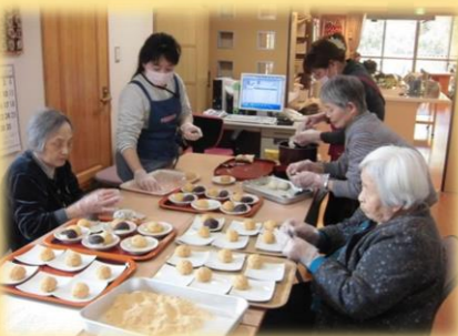
みんなでおやつづくり