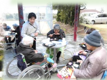
桜を観ながら昼食