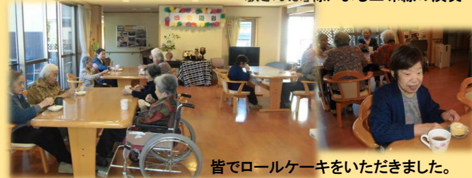
皆でロールケーキをいただきました。