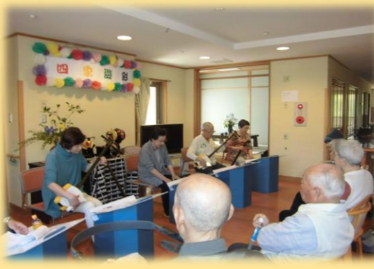
「歌さんぽ」様による三味線の演奏