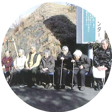
事業団50周年記念植樹

平成27年4月には、国の超高齢化社会を乗り切る対策として、地域包括ケアを前提として介護保険報酬改定等が行われました。高齢になっても住み慣れた地域で暮らせるように、地域の福祉を包括的に担える施設として、これからも皆様方と共に歩んで参りたいと思っております。引き続きご協力・ご支援をお願いいたします。