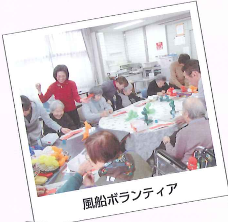
風船ボランティア

当センターの運営理念である「あなたらしさのお手伝い」を大切に、ご利用者が少しでも満足できる笑顔が見られるよう支援しています。 今回は五色・サルビアホールと五色デイサービスセンターの11月以降の活動を写真でほんの一部紹介します。