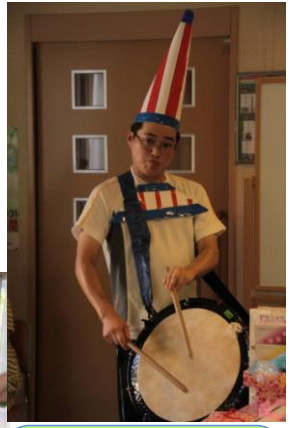
ひろいしの里に ゆるキャラ誕生！？