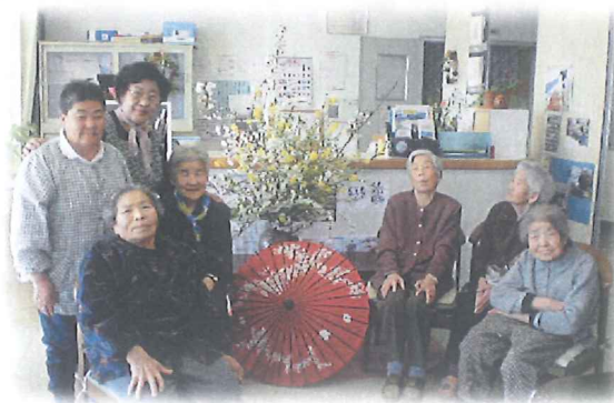
先生を招き、お茶会をしました