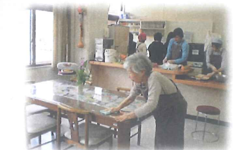
ほっとファイブの手伝い、楽しみ