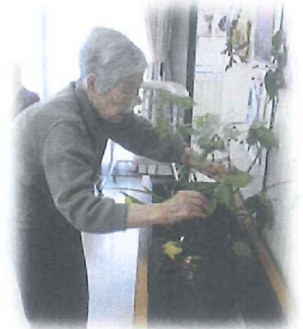
ショウブどこに入れようかな？