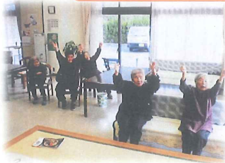
ビデオを見ながら体操