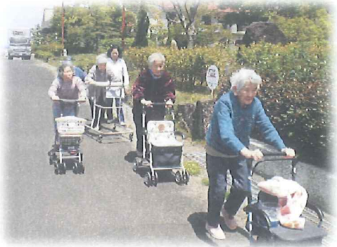
天気の良い日は散歩に出かけています

毎日の散歩や体操、生活リハビリによって、筋力低下の予防に取り組んでいます。年4回、体力のチェックを予定しています。