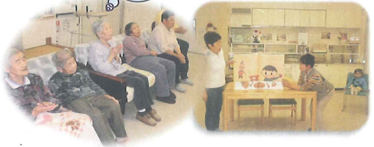
ボランティアグループ「お話隊」との交流

編集後記 例年より早く梅雨入りし、すっきりしない日が続いています。雨の日に「嫌な天気や」と思ふのではなく、梅雨を象徴する紫陽花を室内に飾ったり、ゆつくりお茶を飲みながら雨音を聞いたりして、梅雨を楽しめる方法を考えていきたいと思ひます。