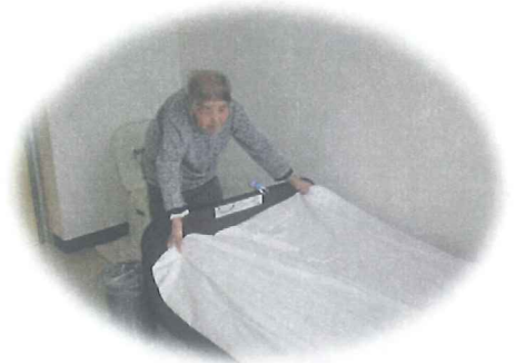
シーツを敷くのは任せて！