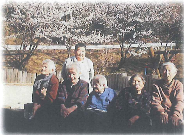
公園で花見をしました

「買い物に行きたい」「コーヒーを飲みに行きたい」等、入居者さんのご希望に沿って外出支援をしています。今年度は合計180回以上を目標に取り組みます。