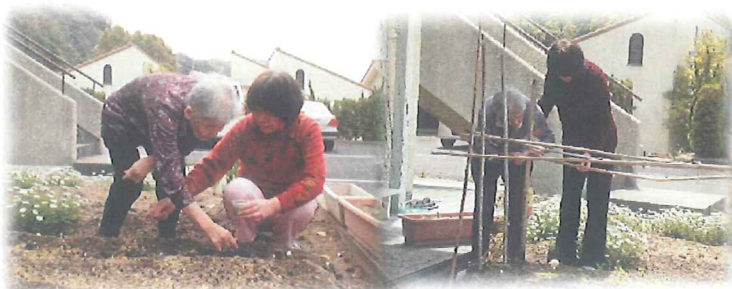
野菜の種まき、支柱立て