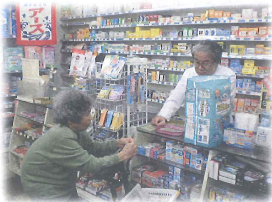
買い物の支払いをしています