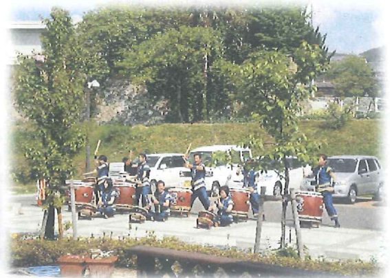
ひろいしの里3周年行事に参加