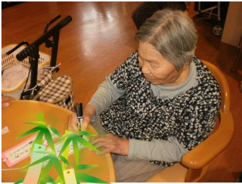
短冊に願いを込めて

・いつまでも元気で過ごせますように。 ・好きな人に逢いたい。死んだ人は帰ってこない。