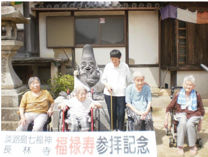
淡路島七福神 長林寺 福祿寿参拝記念