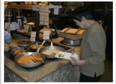
お昼はバイキング!!

10月29日、神戸市北区にある三田プレミアムアウトレットで開催中の木下大サーカスを、ひろいしの里と合同外出で見に行きました。