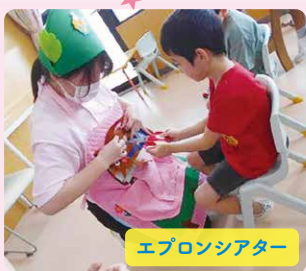
エプロンシアター