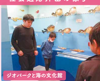
ジオパークと海の文化館