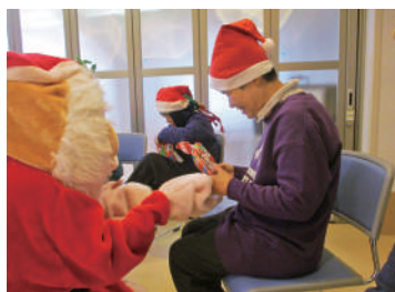
成人寮 クリスマス会