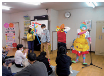
コスモス事業所 お楽しみ会