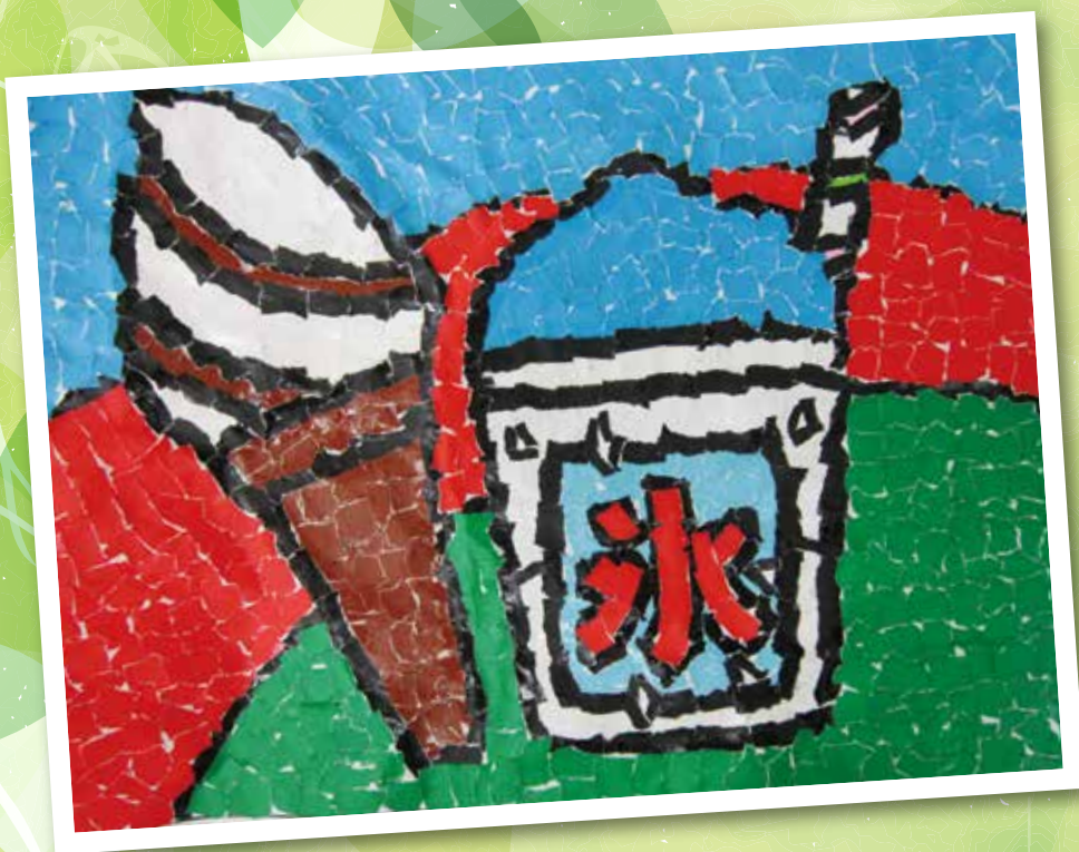
ひんやりデザート