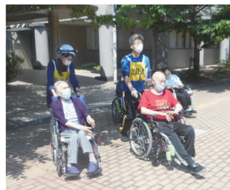
避難訓練(日中想定)