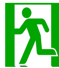
入退館の時間制限