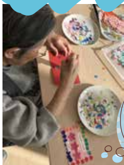
2月8日 メッセージカードを作る