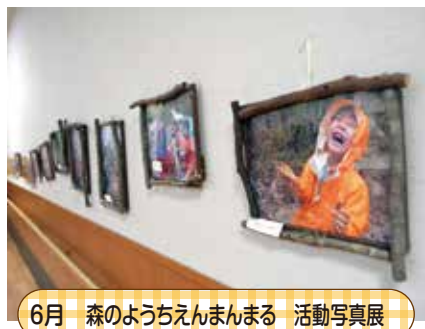
6月 森のようちえんまんまる 活動写真展