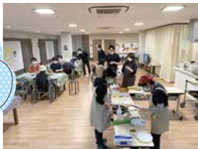
3月11日 く に う み 居 酒 屋