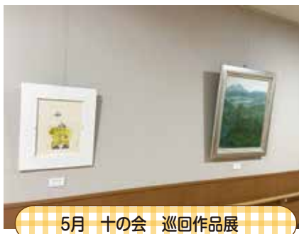
5月 十の会 巡回作品展