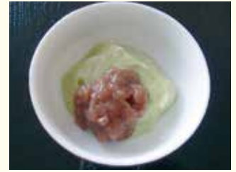
●いびつ餅風ゼリー●