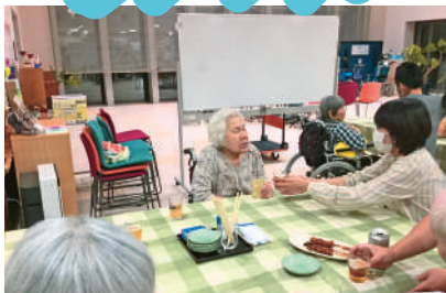
9月29日 居酒屋くにうみ