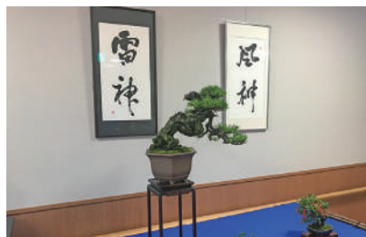
10月 横手希翔・大道正義 書と盆栽展