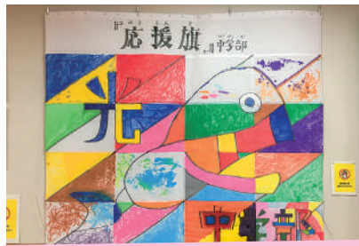
12月 あわじ特別支援学校作品展