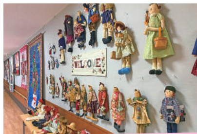
11月 富長寛子 パッチワーク作品展