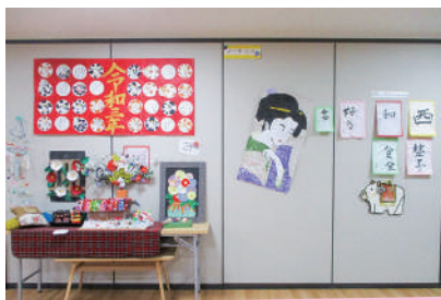
12月 デイサービス活動展