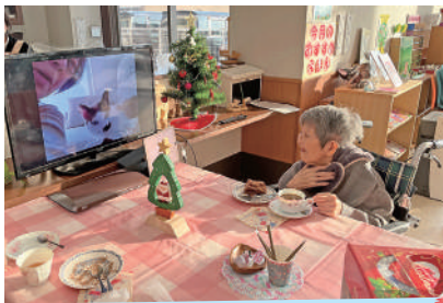
12月22日 喫茶くにうみ