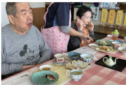
11月24日 くにうみ寿司