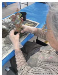
10月2日 苔玉盆栽を作ろう