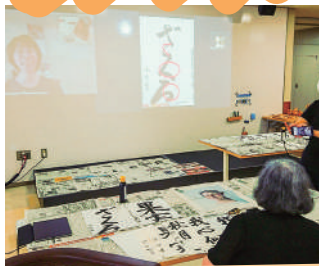
書道クラブ (リモート)