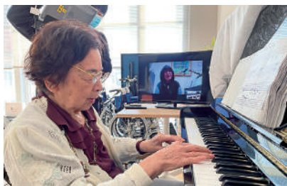
ピアノ教室 (リモート)