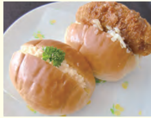
●ロールパンサンド●

嚥下状態の低下した方にも、同じ食材を使用し、手作りです美味しく味わっていただけるよう工夫しています。