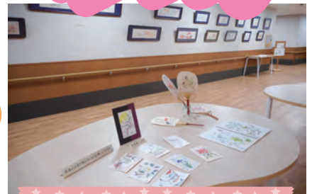
11月 清水流絵手紙 洲本教室作品展