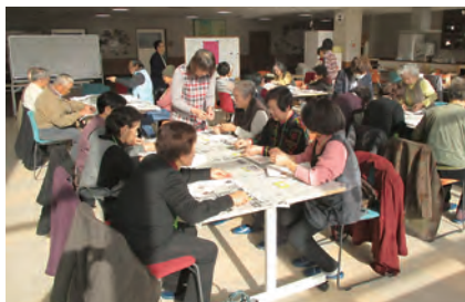
12月19日 下加茂町内会カレンダー作り