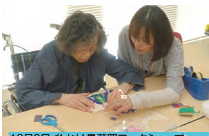
12月3日 糸かけ曼荼羅ワークショップ クリスマスバージョン