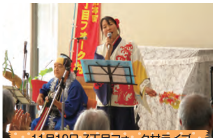
11月19日 7丁目フォーク村ライブ