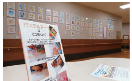
12月 パステル和アート3年間の作品発表展