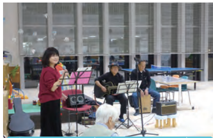
11月18日 ナイトカフェ