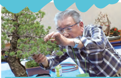
10月30日 盆栽手入れのデモンストレーション