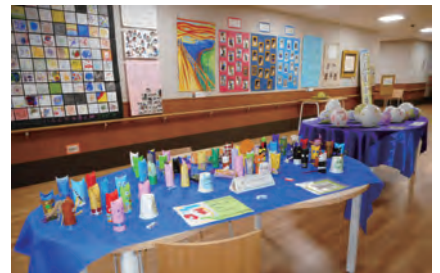
11月 県立あわじ特別支援学校 くにうみ作品展