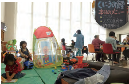
11月5日 くにうみ食堂