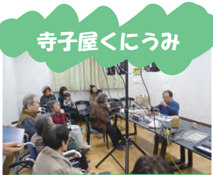
12月22日 科学実験教室