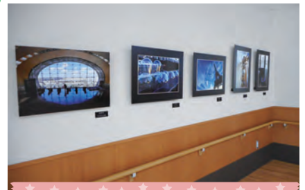
2月 久留米敏仁写真展 旅の光