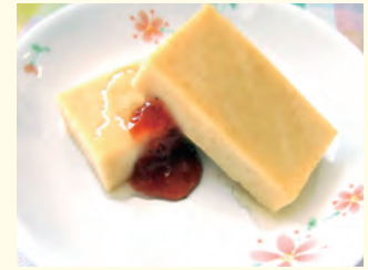
●フレンチトースト風ムース●