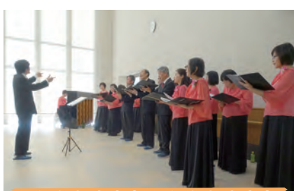
1月19日 あわじ混声合唱団