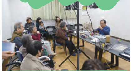
12月22日 科学実験教室