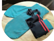
◀スライディンググローブ