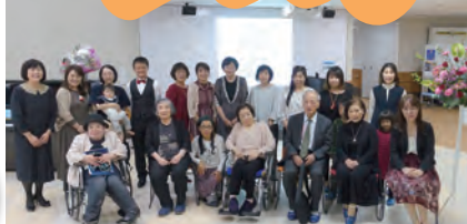
11月30日 ピアノ教室オータムコンサート