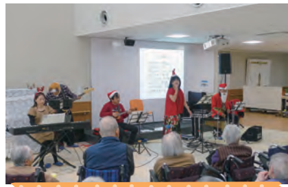
12月6日 笑むバンド クリスマスライブ