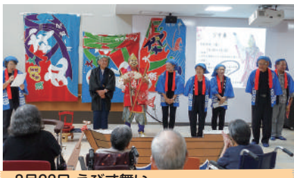
8月23日 えびす舞い いざなぎ学園えびす舞同好会