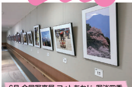
6月 合同写真展 フォトあわじ・写淡四季