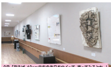
9月 「例えば、10cm立方の作品をつかって、売ってみるとか。」 十の会