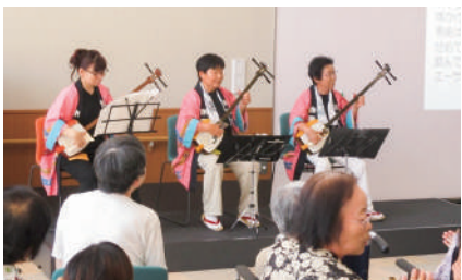
8月8日 三味線演奏会 朱鷺の会