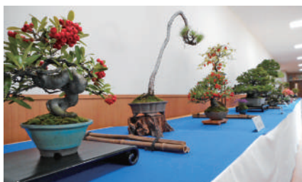
10月 く に う み 盆栽展 盆栽愛好家