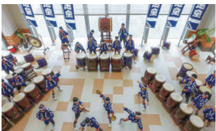
7月6日 和太鼓演奏 三原志知和太鼓クラブ志童