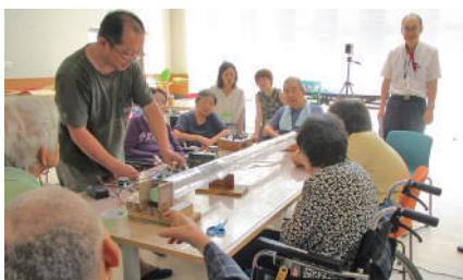
8月10日 音と振動の不思議な実験と糸電話を作ろう