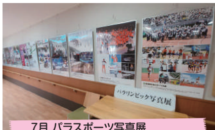
7月 パラスポーツ写真展 兵庫県障害者スポーツ協会