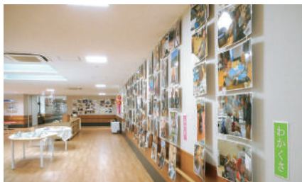
10月 く に う み 活動展