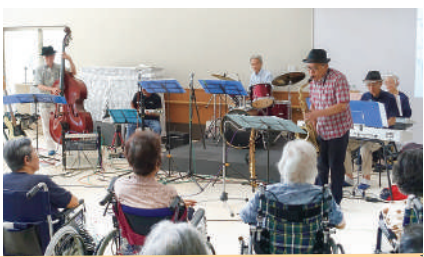
8月11日 ジャズ、ポップス、歌謡曲などの生バンド エブラーヒルスバンド