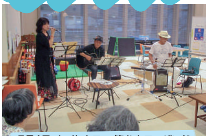
7月4日 ナイトカフェ 笑むカフェバンド