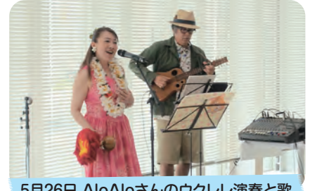
5月26日 AloAloさんのウクレレ演奏と歌