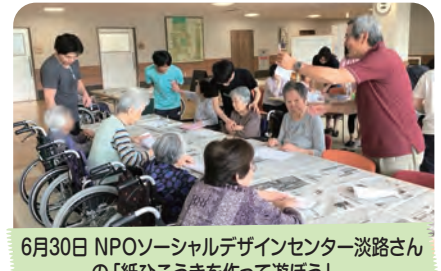
6月30日 NPOソーシャルデザインセンター淡路さんの「紙ひこうきを作って遊ぼう」