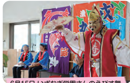
6月15日 いざなぎ学園さんのえびす舞