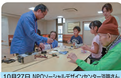
10月27日 NPOソーシャルデザインセンター淡路さんの「コマ作り」