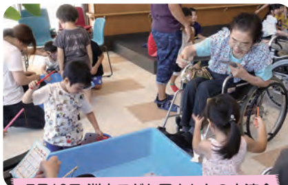
7月10日 洲本こども園さんとの交流会