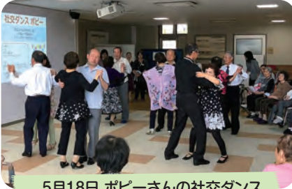
5月18日 ポピーさんの社交ダンス