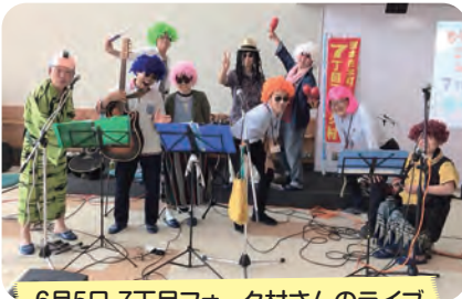
6月5日 7丁目フォーク村さんのライブ