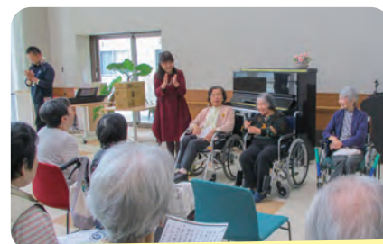
10月31日 くにうみピアノ教室ミニ発表会