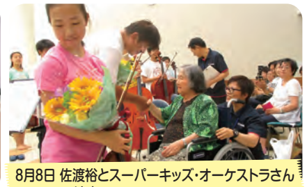
8月8日 佐渡裕とスーパーキッズ・オーケストラさんの演奏