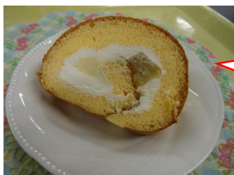
おやつは 小山ロール