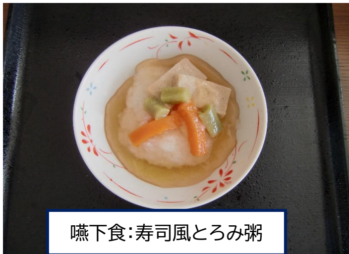
嚥下食:寿司風とろみ粥