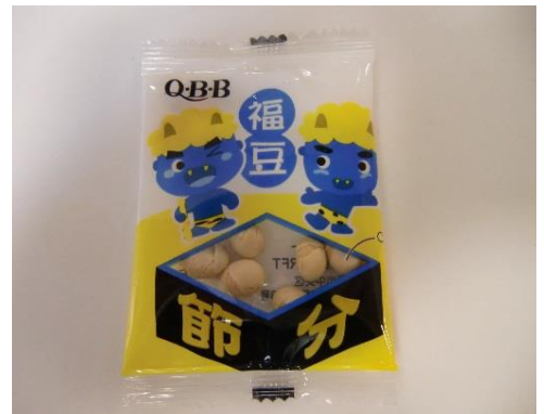
くにうみの里食事担当