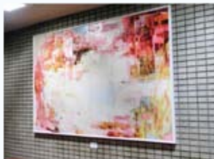
理学療法室前(噴水付近)