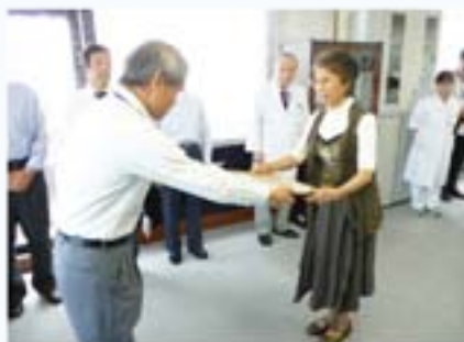
感謝状贈呈式の様子

なお、寄贈絵画は当院1階理学療法室前(噴水付近)、整形外科外来待合室前、小児外来受付前に設置されています。是非ご覧ください。