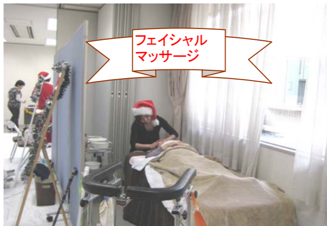
フェイシャル マッサージ