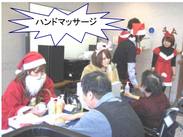
ハンドマッサージ