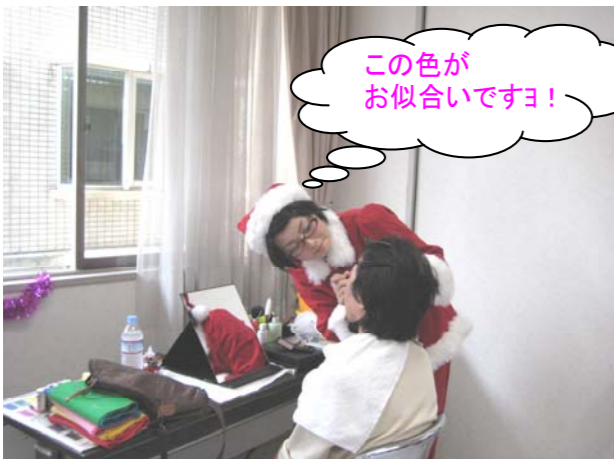
この色が お似合いですヨ!