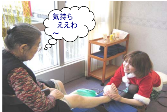
気持ち ええわ 〜