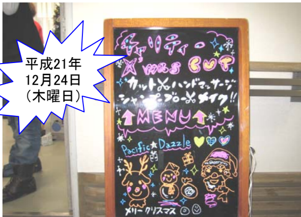
平成21年 12月24日 (木曜日)

平成21年12月24日(木)に、(株)和樂から約50名のスタッフの方に来ていただきました。カット、メイク、フェイシャル、ハンド&フットケアなど入院患者様の美容ボランティアをしていただき、「きれいになった」、「気持ちよかった」など入院患者様が笑顔でとても喜んでおられました。