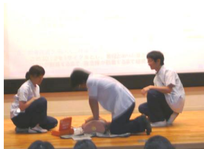
《救急教育活動実演風景》