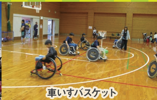
車いすバスケット