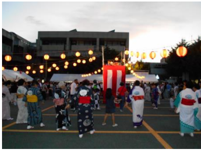
「盆踊り大会」(総合リハ)