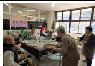
「ほっとファイブ」(五色・サルビアホール)