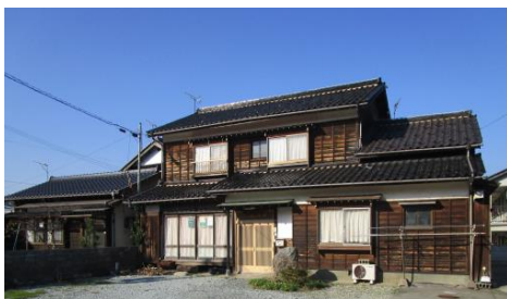
「香美町香住区の空き家活用」(ひまわりの森)