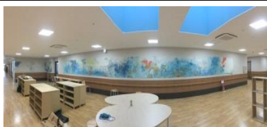
「くにうみ美術館」(くにうみの里)