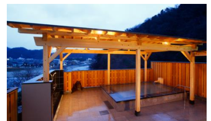
「観音の湯」(露天風呂)