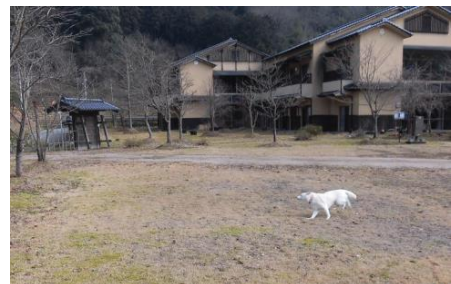
「まるこガーデン(予定地)」(たじま荘)