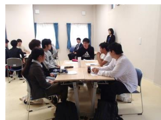
サテライトゼミの様子