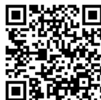
先輩情報・仕事紹介