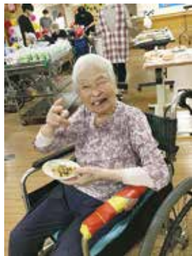
お好み焼きおいしい!!