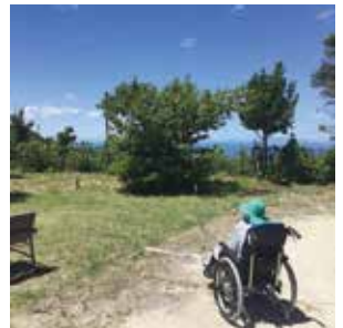
あわじ荘散策! こんなに景色のええところ あるんやな~