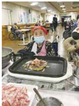
お好み焼き 美味しくできました! 召し上がれ!