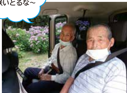
淡路島公園にてあじさい鑑賞ドライブ