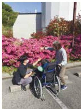
つつじ観賞、 今年も鮮やかに咲きました!