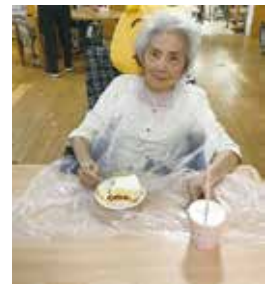
誕生日会でケーキを食べました! 甘くておいしい!