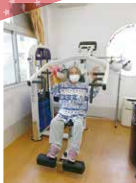
マシントレーニング