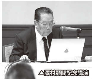
△澤村顧問記念講演