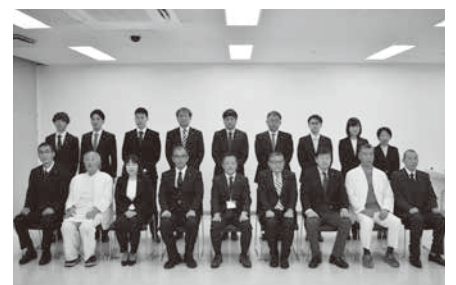
▲職員表彰(理事長賞)