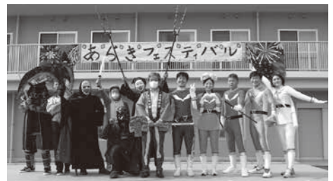
あざきフーズパル

出石精和園 十月、各寮(成人寮第一・三成人寮、地域交流センター)に分かれ代替行事を開催しました。今年も利用者様と職員との開催となりましたが、各寮とも趣向を凝らし、コロナ禍でも出来る事を思いっきり楽しんでいただきました。また、「いざしり口マン(よさこい)」が披露され、イベントの中止が続き活動が出来ない中、この日の為に一生懸命練習を重ねた成果を発揮する事ができました。各日とも晴天に恵まれ、思い出に残る一日となりました。