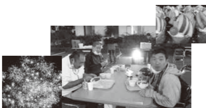
小野起生園・小野福祉工場

丹南精明園 コロナ禍では二回目の園祭となりました。利用者様、職員のみ開催となりましたが、外部のキッチンカーや当法人のパン屋さんを招き、昨年より少しバージョンアップして行うことができました。やっぱり園祭はいいですね。