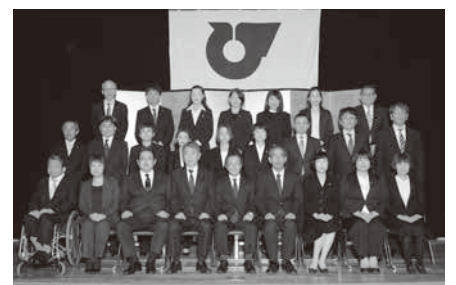
▲永年勤続職員表彰