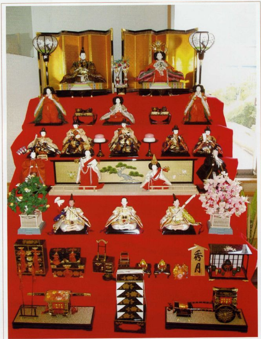
地域の方からお譲りいただいた素晴らしい雛壇です。