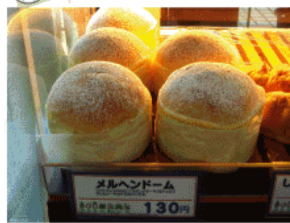
メルヘンドーム 130円