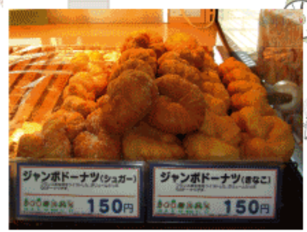
ジャンボドーナツ 150円