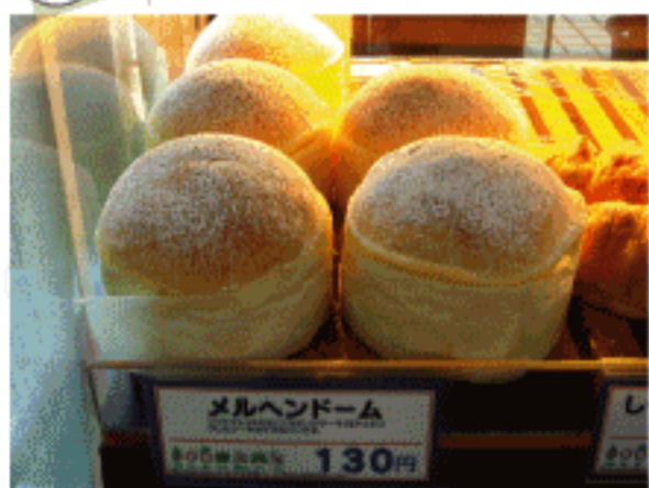
メルヘンドーム 130円