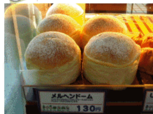
メルヘンドーム 130円