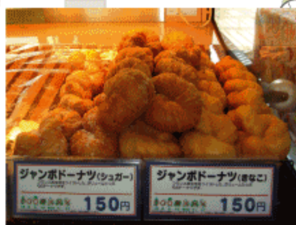
ジャンボドーナツ 150円