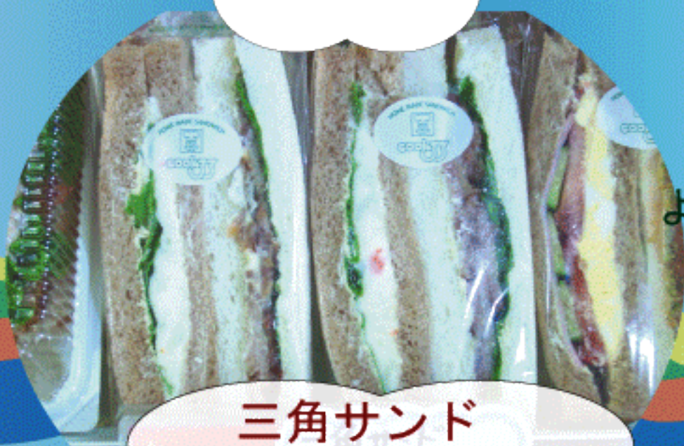
三角サンド (照り焼きチキン)