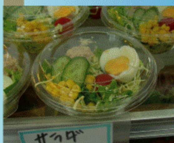
あけほのサラダ 180円