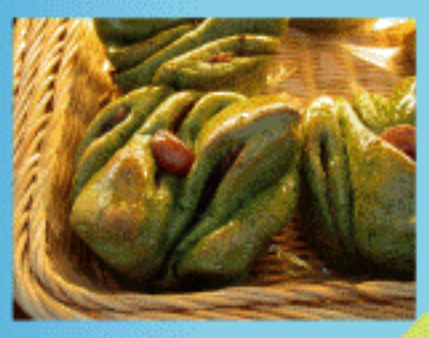
よもぎあんロール 100円