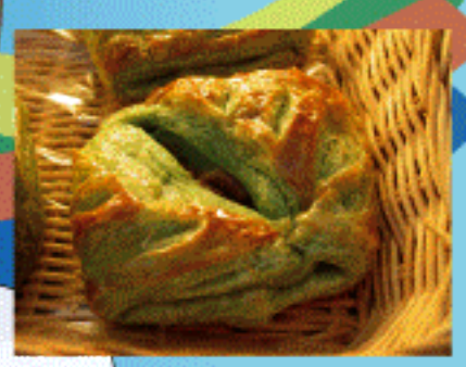
抹茶もち風デニッシュ 120円