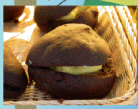
ショコラ クリーム 各140円