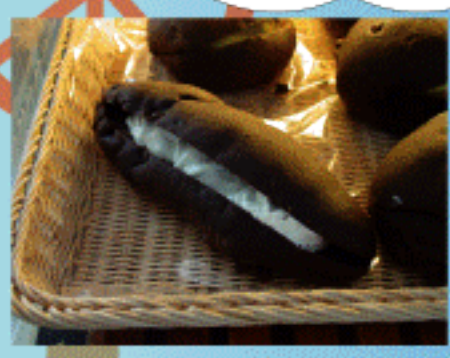
ショコラ&ホイップ