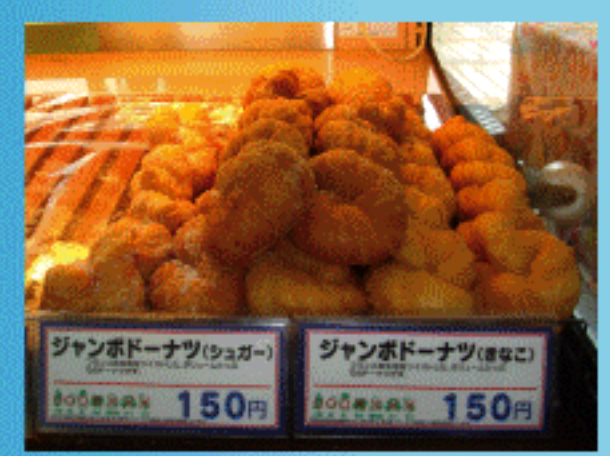
ジャンボドーナツ 150円