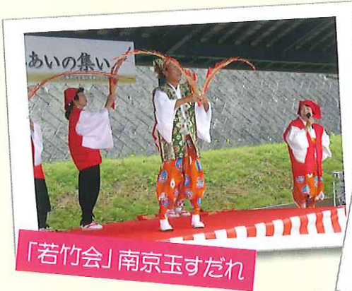
「若竹会」南京玉すだれ

発行日 平成26年2月発行 発行者 社会福祉法人 兵庫県社会福祉事業団 丹寿荘 兵庫県丹波市市島町上竹田2336-1 電話 0795-85-3251 FAX 0795-85-0075 http://www.hwc.or.jp/tanju