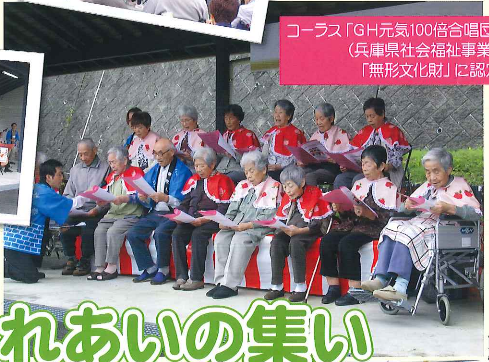
コーラス「GH元気100倍合唱団」 (兵庫県社会福祉事業団 「無形文化財」に認定)