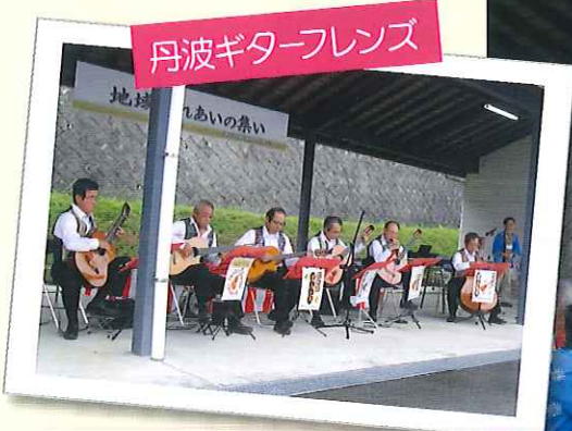
丹波ギターフレンズ