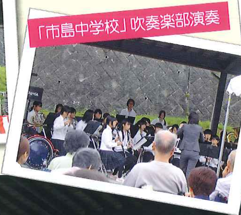
「市島中学校」吹奏楽部演奏