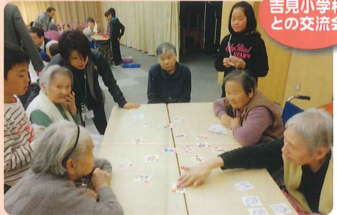
吉見小学校との交流会

毎年の恒例でもある吉見小学校との交流会。金管バンドの演奏後に子どもたちとわいわいと楽しみます。