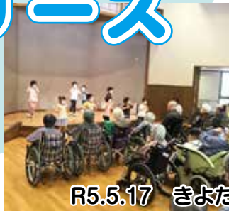
R5.5.17 きよたきこども園交流会

新型コロナが流行してから交流出来なかった地元こども園との交流会が今年復活!! 直接、触れ合うことはなかったですが、ステージ上での楽器の演奏、踊りの披露に入所者様は喜ばれていました。やはり子どもらに勝るものはないなと感動しきりでした。