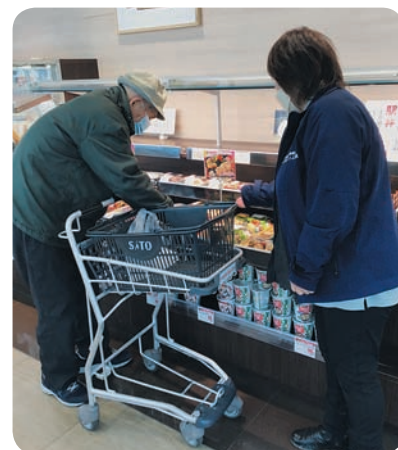
買い物の付き添い