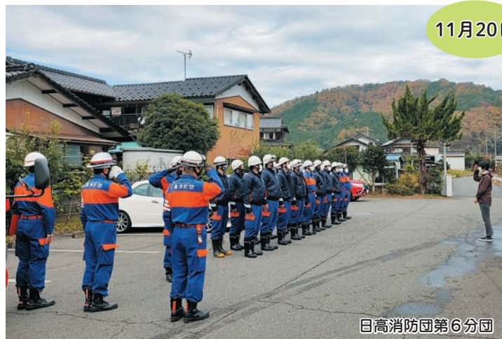
日高消防団第6分団

ことぶき苑では年2回の避難訓練を実施しています。第2回目の訓練では、地域消防団や地域住民の方々、総勢40名参加して頂き不測の事態に備えた避難経路や協力体制を再確認できました。コロナ禍であっても避難訓練は必要です。