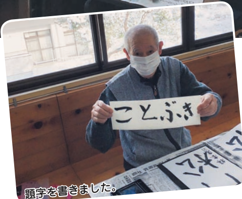
題字を書きました。