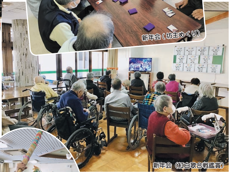
新年会（紅白歌合戦鑑賞）