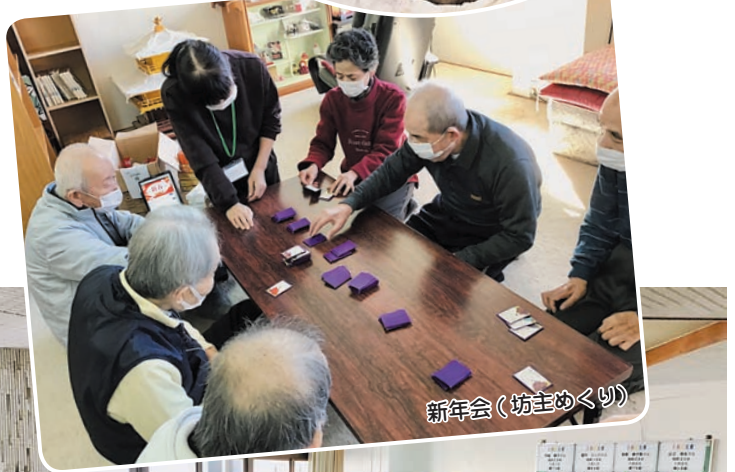
新年会（坊主めぐり）