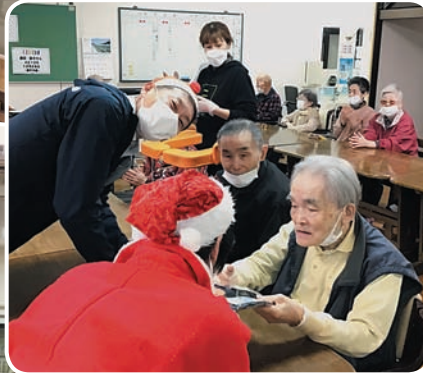
クリスマス茶話会