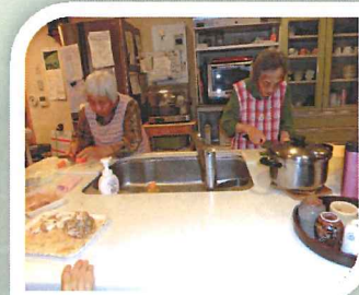
掃除、お料理、裁縫...家事ならお任せ