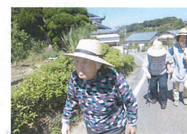
運動のため、歩いて買い物