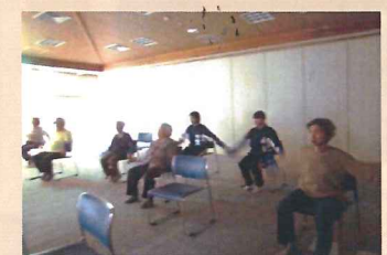
いきいき 百歳体操