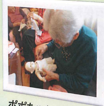
ポポちゃんの服を作成