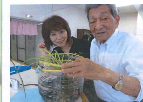
メダカいただきました