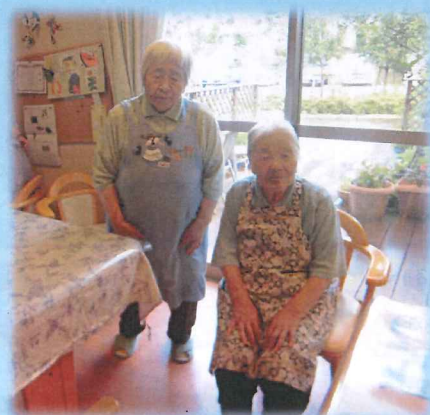
エプロン姿でお出迎え