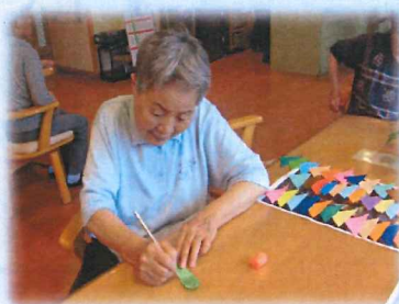
飾り付けも入念に行いました