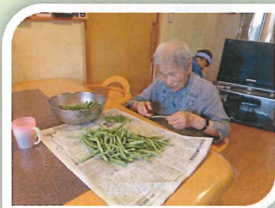
103歳、目もよう見えとります