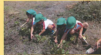
ひろいし畑でじゃがいもほり ヨイショ!