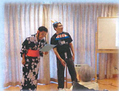
ひろいし名物! 食い倒れ太郎・花子による漫才