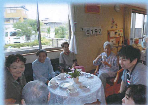
地域の方もたくさん来ていただきました