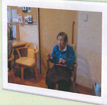
毎日の体操は欠かせません