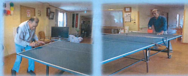
各ステージで熱い戦いが繰り広げられました