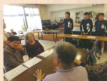
五色グループホームとの交流