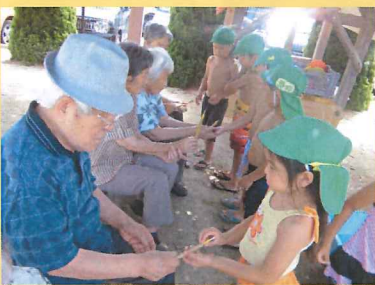
手作りの水鉄砲をプレゼント