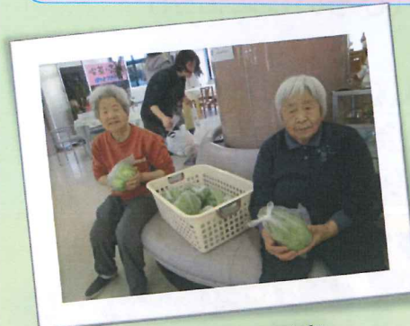
採れたて野菜を販売