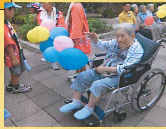
広石キッズとハイポーズ!