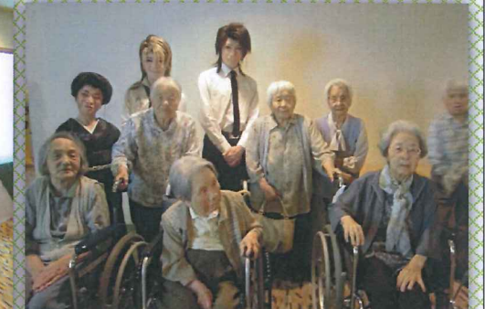
6月15日、21日 南淡路ロイヤルホテルで劇団『天華』を観劇