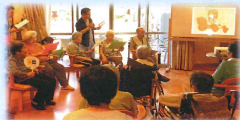
利用者・職員による七夕にまつわる朗読劇