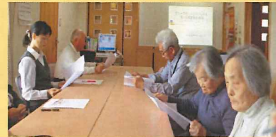
2ヶ月に1回開催。 皆様から貴重な ご意見をいただ いています

ひろいしの里では地域の一員として溶け込めるよう、各行事へ参加させていただくとともに、地域の方にも気軽に足を運んでいただける施設を目指しています。地域の皆様と触れ合うことで、たくさんの方に支えられていることを実感しています。