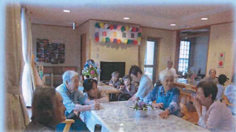
顔なじみの人と楽しいおしゃべり