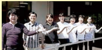
向山石松後中中 原田上本中山村