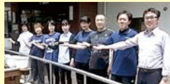
前山後武笹藪卯名 田田藤本山田野倉