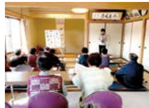
〇ミニ講座「高齢者の食生活」の様子