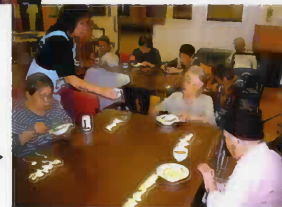
皆で楽しくおやつ作り!! 美味しく作れたよ!!