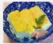
最近の郷土料理「こけら寿司」

食事から、懐かしい味を伝えることができればと、毎月のお弁当日や行事食等では郷土料理や旬の食材を使用した食事を提供しています。