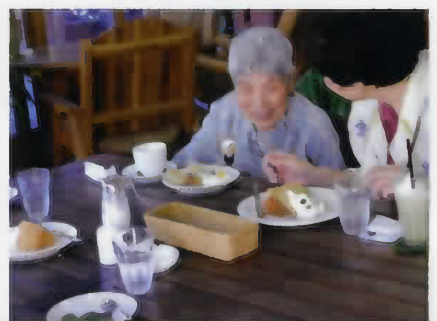
ケーキを食べる利用者さん。 「美味しい」と笑顔でした。