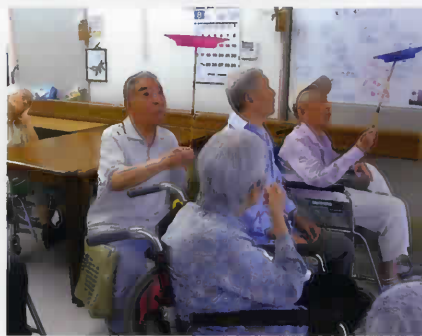
レクリエーション活動で歌を歌ったり、 皿回しをして楽しかったよ。