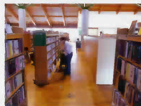
◀図書館で本を選び中 (。')真剣な顔!