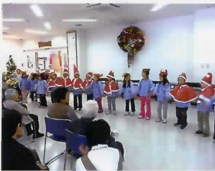
都志保育所の園児との交流です。 かわいいですねえ