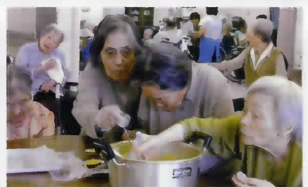
月一回は手作りおやつを行っています。 10月はスイートポテトを作りました。 今後、嘉兵衛の里ではミカン狩り等 みんなが楽しめる外出を計画しています。