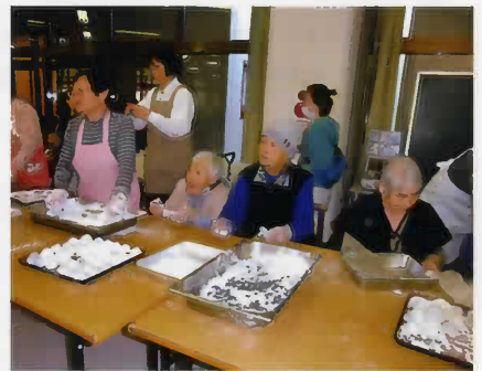
年末恒例餅つきです。よいしょー!!