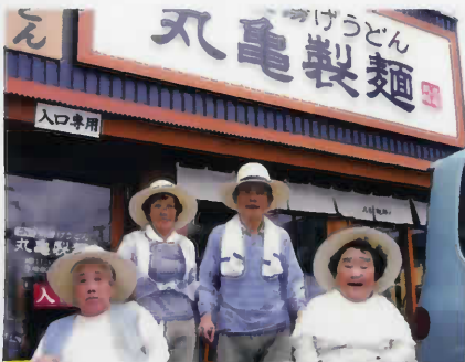
楽しみにしていた讃岐うどんを 食べにきました。なに食べようかな～?