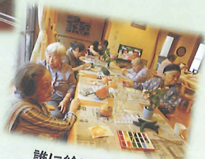
誰に絵手紙送ろうかな?