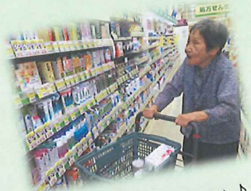
お買い物は楽しい!