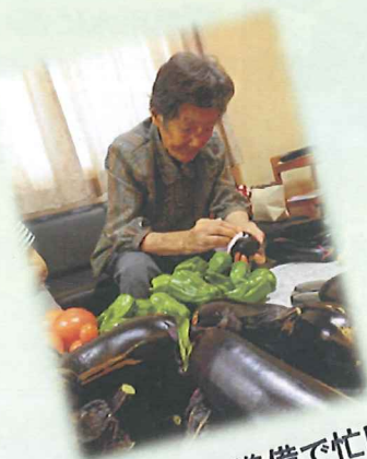
野菜の出荷準備で忙しいわ