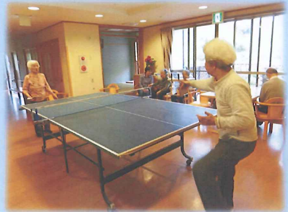
決勝戦は真剣です！