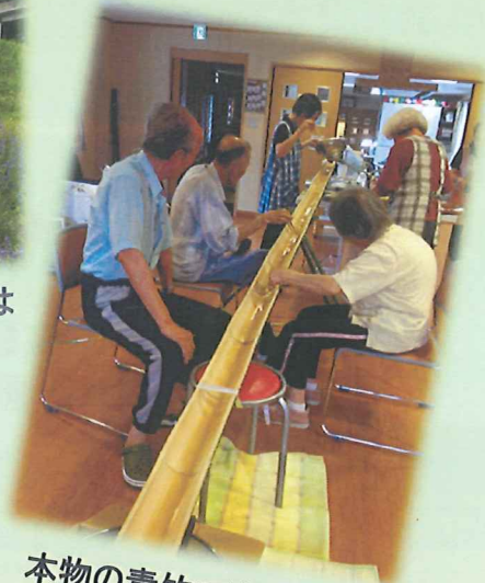
本物の青竹で流しそうめん!