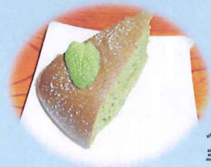
人気の手作りケーキ