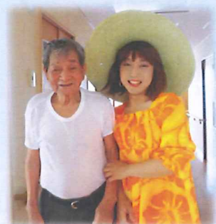
さあ、右の方は女性かな？