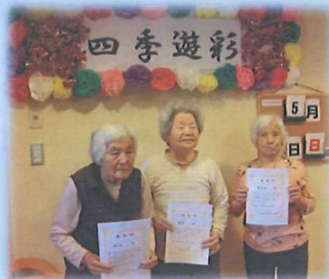
ピンポン大会の入賞者の強者です！