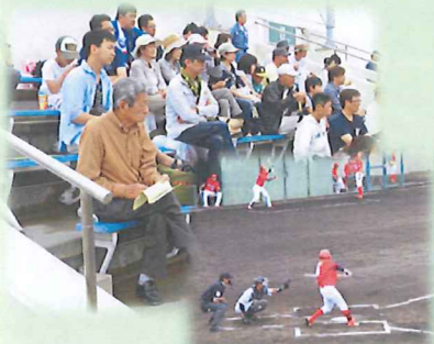
阪神VS広島 どっちが勝つか?