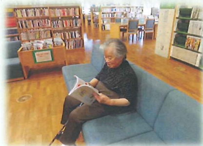
たまには読書もええで