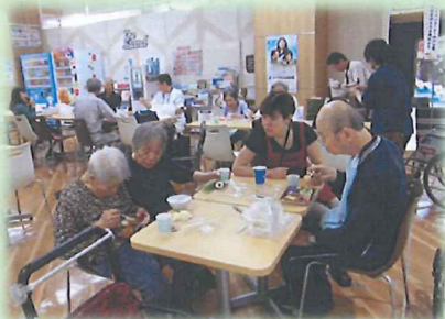
イオン淡路店へ外出