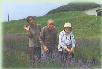
ラベンダー畑でこんにちは