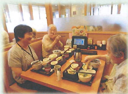
ご馳走がようさんあるわ