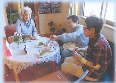
地域の方とおしゃべり