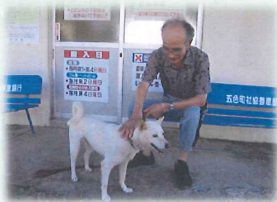
公会堂前で一休み