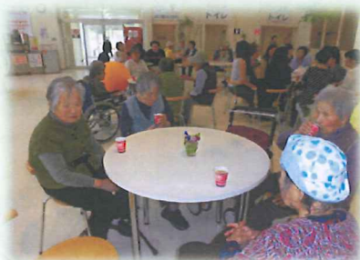
たこせんべいの里で休憩中