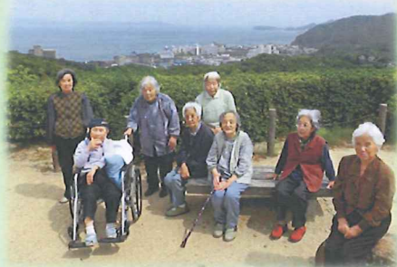
三熊山で記念撮影