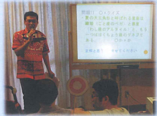
O×クイズでシンキングタイム！