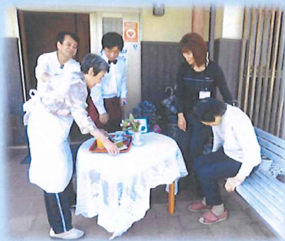
お待たせしました