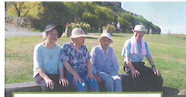
あわじ花さじきで遠足