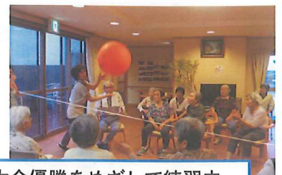
大会優勝をめざして練習中