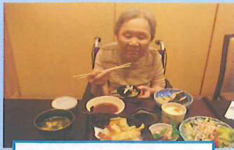
えびの天ぷらに舌鼓