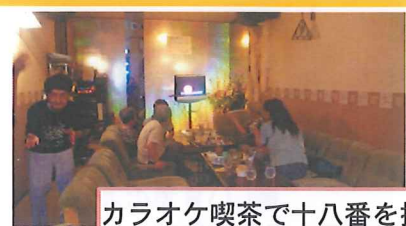
カラオケ喫茶で十八番を披露