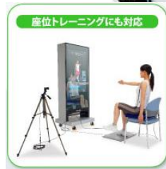
ムーブコアエクササイザー