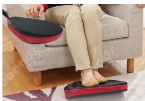
ゆらゆらボード 「ながら」で手軽に足の運動ができる